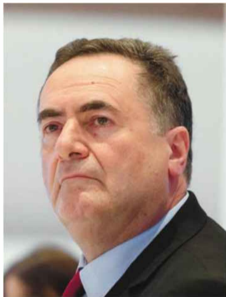
אדם במלון קורונה בתל אביב ושר האוצר, ישראל כ"ץ. צוות של האוצר צפוי לפרסם את מסקנותיו בהקדם

ממשרד האוצר נמסר בתגובה: "צוות בינאגפי בראשות מנכ"לית משרד האוצר פועל בשבועות האחרונים במטרה לתת פתרון כולל לשאלת ימי הבידוד. הצוות צפוי להגיש את מסקנותיו בהקדם".